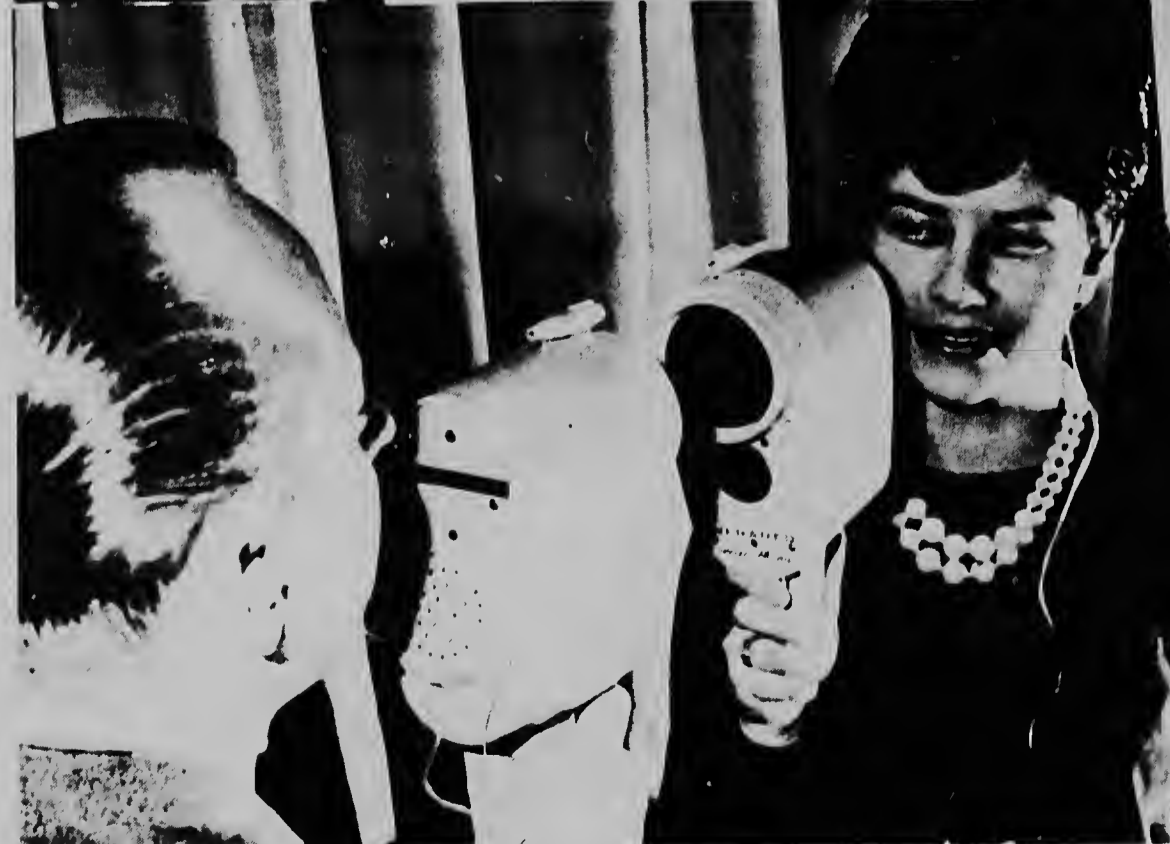
Na Alemania nan a trese un aparato nobo riba mercado cuta permiti dos hende papia cu otro riba un distancia di 100 meter sin hasi uso di wayanan. Aki dos persona ta duna un demostracion di e aparato nobo cu ta traha cu rayonan di infrarood.